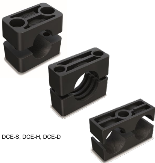
DCE-S, DCE-H, DCE-D